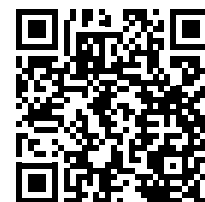
Canción “La Samaritana”.