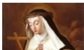
17 DE ABRIL BEATA MARIANA DE JESÚS NAVARRO