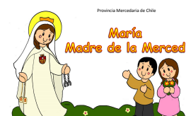
2016 LIBRITO DE LA VIDA DE MARÍA DE LA MERCED